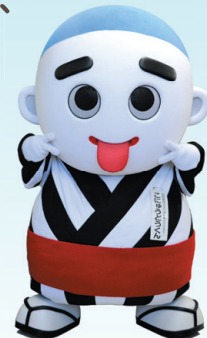
四日市市マスコットキャラクターこにゅうどうくん

この「こころの健康・福祉のフェスティバル」を通して、精神障害に対する理解が広がっていくことを 切に願っています。より多くの皆様のご参加をお待ちしております。